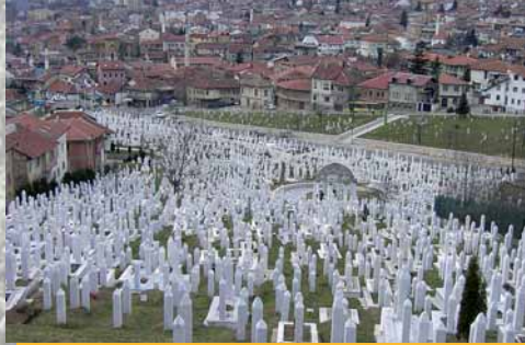
Muslimischer Friedhof in Sarajevo

phäre unter uns war meine aktive Mitarbeit zur Vorbereitung und