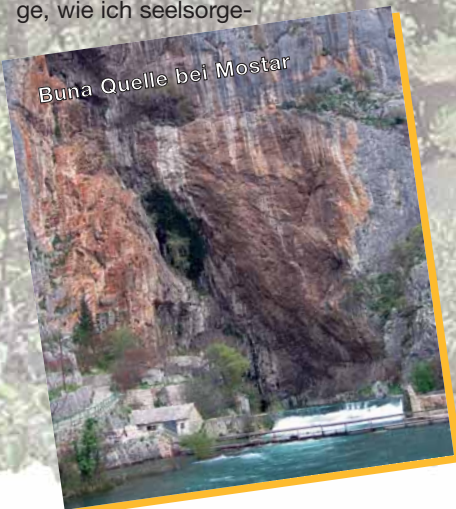
Buna Quelle bei Mostar

risch während meiner fast 5-monatigen Einsatzzeit betreut werden kann. Nachdem die Gemeindeabfrage im Internet und Anfragen bei mir im Bezirk keinen Gottesdienstort in Bosnien und Herzegowina ausgeworfen hatten, blieb scheinbar nur die „Selbstversorgung“. Erst kurz vor Einsatz erfuhr ich über meinen Apostel, dass es in Konjic doch eine neuapostolische Gemeinde für Bosnien und Herzegowina gibt, welche durch den Apostelbereich Tübingen betreut wird. Da in dieser Gemeinde allerdings kein Priester verfügbar war, liefen sodann die Telefone heiß und in meinem Marschgepäck befand sich am Ende – neben Bibel, Gesangbuch und Hostien – auch ein „Uniformteil“ der besonderen Art: mein schwarzer Anzug. Nach Absprachen der Bezirksapostel Brinkmann und Saur sollte ich nämlich – soweit mein Dienst es vor Ort zulässt – die Gemeinde in der Durchführung von Gottesdiensten unterstützen.