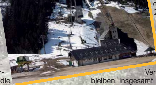
Olympiaschanze in Sarajevo

hohen Dienstbelastung von zum Teil über 80 Stunden in der Woche – die Zeit geradezu rast. Zum Glück war es da möglich, über Telefon mit meiner Familie in