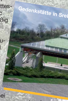
Gedenkstätte in Srebrenica