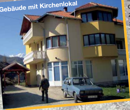
Gebäude mit Kirchenlokal