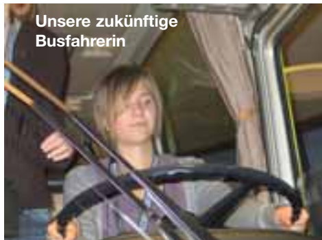
Unsere zukünftige Busfahrerin

Nach dem Jugendgottesdienst am Morgen durch unseren Bezirks-