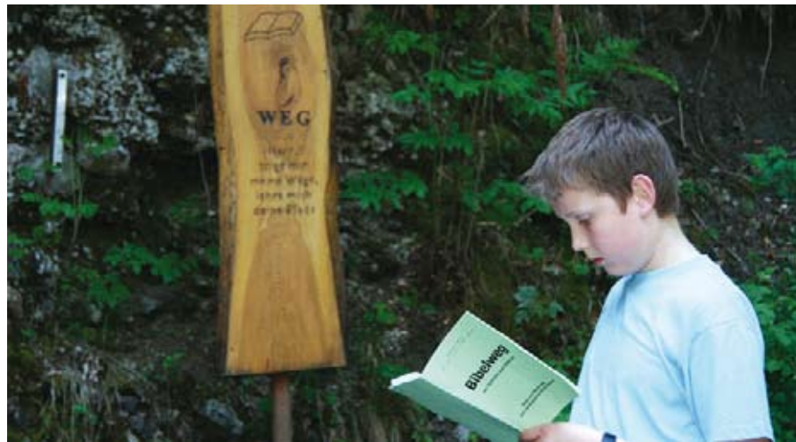
Impressionen vom Bibelweg in Nenzing.

Die Rückfahrt verbrachten dann die einen mit Schlafen, die anderen mit Singen. Ich denke aber, dass sich der Ausflug für jeden gelohnt hat und es ein schönes Erlebnis war. (Ds)