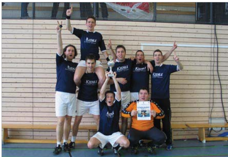
Die Sieger (Tübingen) vom letzten Jahr stellen sich ihren Herausforderern.

Herausgeber: NAK RT Süd + West | Layout + Produktion: Jan Kittelberger, Jens Lang | Korrektur: Andreas Pfäffle | Auflage: 430 Stück (+ E-Mail-Versand) | Druck: DigiPrint Fink Druck, DigiPrint Kittelberger media solutions eMail: jugendinfo@gmx.net