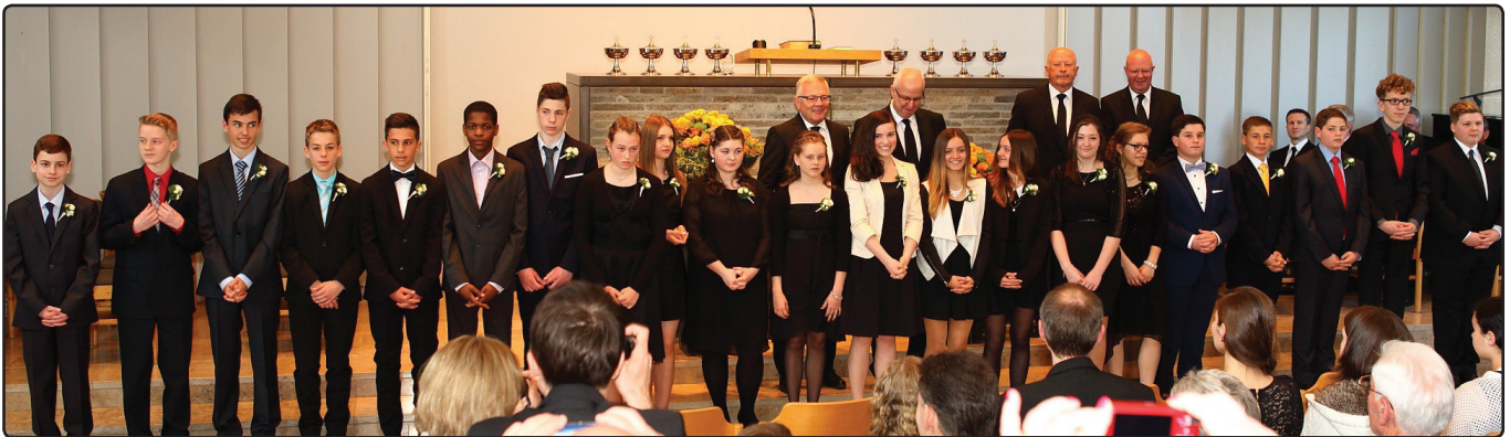
RT-West – von links nach rechts: