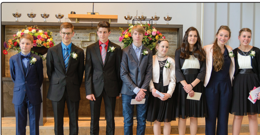
RT-Süd – von links nach rechts: